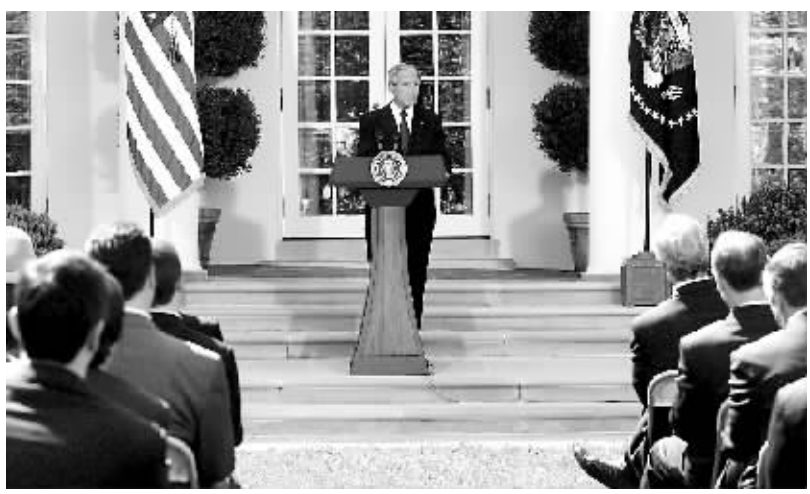
4月16日,美国总统布什在白宫发表讲话称,美国将在2025年前使其温室气体排放不再增加。但任期只剩下半年多的布什没有列出保证实现这一目标的具体细节,而且再次拒绝设置强制减排目标。

在此为期两天的闭门会议中,代表们将在前两次会议的基础上,就实现可持续发展的长期目标、减排的行业方法、技术合作、融资以及气候变化的适应等热点问题展开讨论。此外,与会各方还将致力于推动《联合国气候变化框架公约》下的谈判。