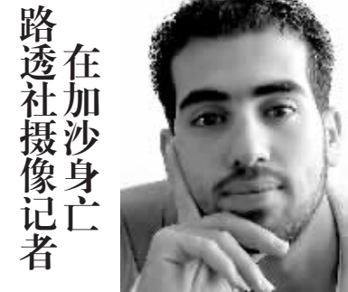
路透社摄影记者在加沙身亡者。4月16日,巴勒斯坦急救部门负责人哈撒内说,以军当天下午空袭加沙中部布赖杰难民营,打死至少10名巴勒斯坦人,其中包括前往事发地报道的路透社记者法德勒·沙纳。这张资料照片上是路透社摄影记者法德勒·沙纳。

禁令还禁止在公用交通工具上出现声响大的音乐。不过,即使人们上车前不愿关小手机铃声,也不会被罚款。格拉茨市此举引发较大争议。不过,施蒂利亚州的日报《小报》一项民意调查显示,68%的格拉茨市民赞同这项禁令。奥地利其他一些城市也在考虑采取类似措施。