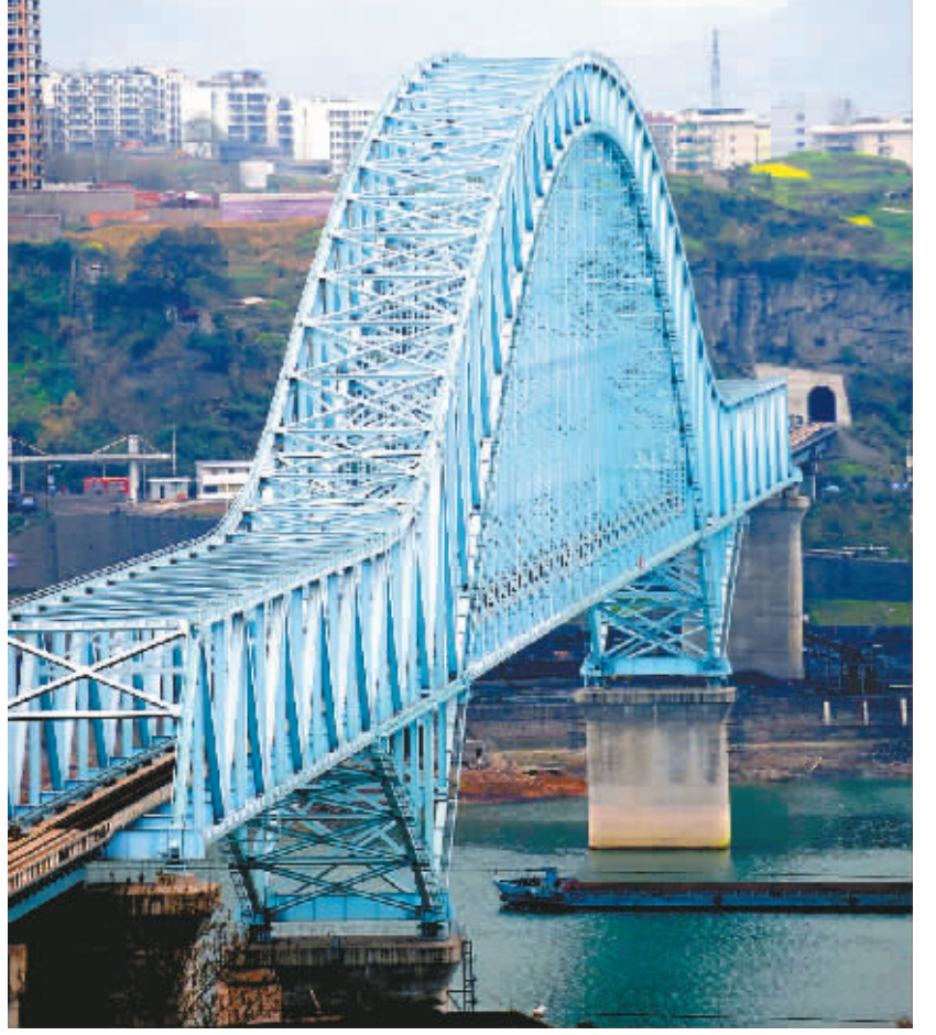
万宜(万州至宜昌)铁路万州长江铁路大桥远跳(3月5日摄)。建设中的万宜铁路全线总长377公里,是我国铁路网“八横八纵”主骨架之一。目前,全线轨道工程进入收尾阶段,即将进入下一道工序施工。