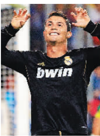
四比〇胜马拉加队。克洛·罗纳尔多上演了帽子戏法。 二十三日,在西甲第九轮比赛中,皇马

本报海口10月23日讯(记者黄晶)今晚,2011中国体育旅游博览会志愿者授旗仪式暨动员大会在海口举行,来自海南工商职业学院的上百名学员将进入会前的紧张培训工作。 据了解,2011中国体育旅游博览会将于11月11日至14日在海南国际会展中心举行,届时将有600多家中外企业参展。 为了做好展会的服务工作,体博会组委会特招募志愿者为展会提供贵宾引导、展览接待、临时翻译、资料收集等志愿服务。