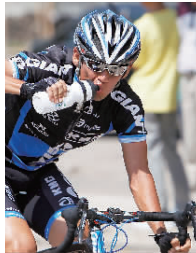
23日,一位台北捷安特建大洲际队车手在比赛中补充饮水。