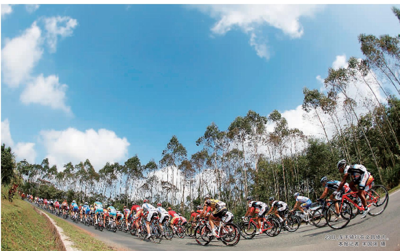
23日,车手骑行在文昌境内。