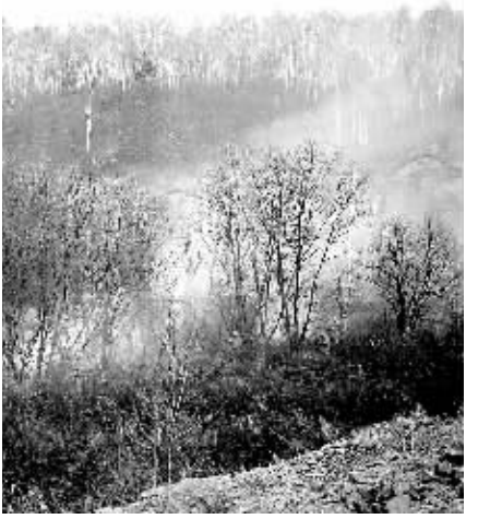
官兵们争分夺秒控制火情。

上海宽带大提速 将成为全国首个T级别出口宽带能力城市 据新华社上海5月1日电 记者从中国电信上海公司获悉，今年内上海IP城域网出口层连接CHINANET将达到1140G的出口能力。