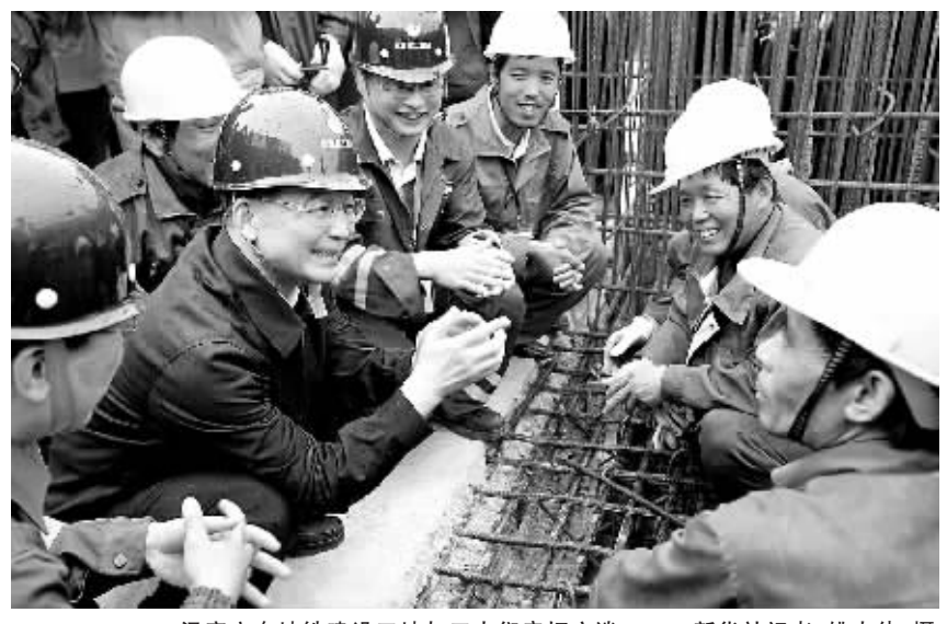
温家宝在地铁建设工地与工人们亲切交谈。

温家宝说，党和政府十分关心农民工。为改善广大农民工的工作和生活条件，采取了一系列政策措施，加强农民工培训，吸收更多农民工就业；建立包括工伤、医疗、养老在内的比较完善的保障体系，工伤和医疗保险，大多数已经建立起来了，养老保险及转移接续制度正在制定；高度重视农民工的生产安全，你们的工地也安上了安全监测仪。