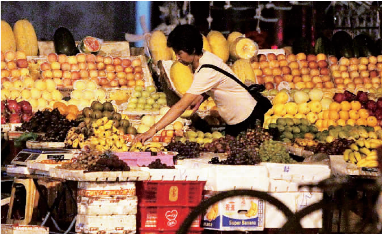
凌晨，海口街头的水果商贩。