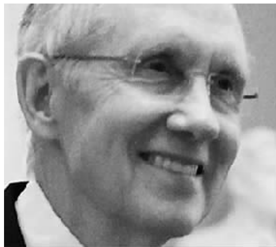
参议院多数党领袖里德(民主党)

7月25日,利比亚首都的黎波里以东兹利坦镇的一间粮仓被烟雾和火焰包围。利比亚政府说,北大西洋公约组织战机当天空袭首都的黎波里以东兹利坦镇,炸死7人,摧毁粮仓和医院。