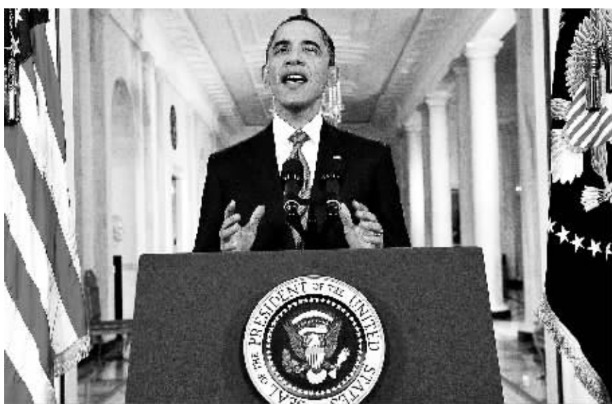
7月25日,在美国首都华盛顿,美国总统奥巴马在白宫发表讲话。

新华社华盛顿7月25日电(记者阳建 刘丽娜)美国总统奥巴马25日晚发表电视讲话称,如果美国两党没能在提高债务上限和削减赤字问题上达成一致,一旦出现债务违约,美国经济将会严重受损。奥巴马说,如果债务谈判仍不能取得进展,不断增长的债务将会造成就业岗位流失并严重损害经济。他指出,美国正在危险地接近债务违约,这将是“不顾后果和不负责任”的结果。奥巴马还表示,他反对短期提高债务上限的方案,并强调“两党都有责任解决这一问题”。目前距离美国财政部设置的8月2日债务违约最后期限仅剩约一个星期时间,截至25日美国两党仍未就债务谈判达成一致。当天,美国众议院共和党在议长博纳率领下提出了新版本的提高债务上限和削减赤字方案。该方案提出“分两步走”的提高债务上限策略,先期提高债务上限1万亿美元,并在10年内减赤12万亿美元,但明年年初必须再就提高债务上限问题进行谈判。参议院多数党(民主党)领袖里德当天也推出了自己的提高债务上限方案。该方案建议把债务上限提高24万亿美元,同时在十年内减赤27万亿美元。这项方案满足了白宫力促美国偿债能力支撑到明年大选以后的要求。然而,共和党和民主党相互不买账,两个方案表明双方仍存在较大分歧。