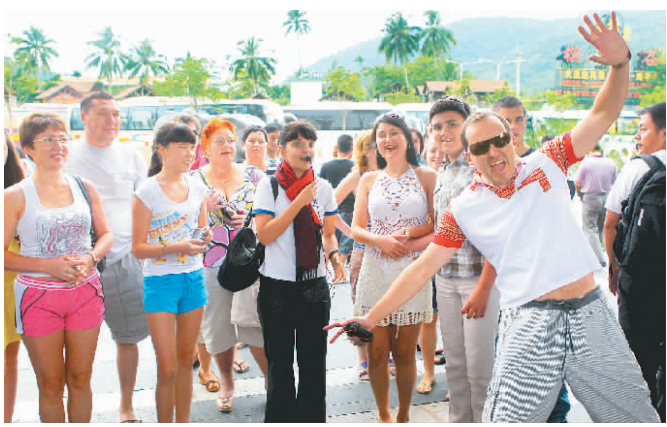
11月25日,一批俄罗斯游客来到甘什岭槟榔谷海南原住民族文化游览区。据游览区负责人介绍,11月份已进入旅游旺季,与往年同期相比,接待游客数量又达新高峰。

据了解,此次海航新增的航班主要集中在太原、合肥、桂林、广州、天津、郑州、长沙、银川等城市飞往海口的航线上,以及贵阳、济南、广州、武汉、乌鲁木齐、福州、连云港等城市飞往三亚的航线上。其中,广州-海口航线经此次加密后每天将有7班往返;太原-海口航线加密后每天将有3班往返。