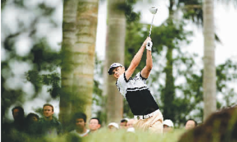
11月26日,第56届高尔夫世界杯进行第三轮四人四球比赛。图为德国选手马丁·凯梅尔在比赛中挥杆。 (更多报道见A8版)