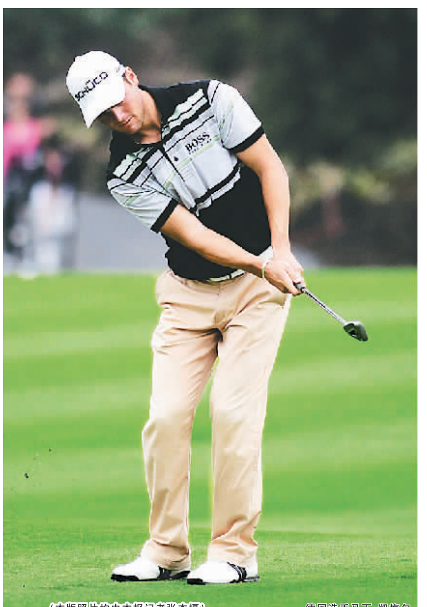
德国选手马丁·凯梅尔

只“小鸟”,而他的队友亚历克斯·谢卡也贡献了4只,两人凭借第三轮的61杆,低于标准杆11杆,从25日的第10名跃居至并列第二。