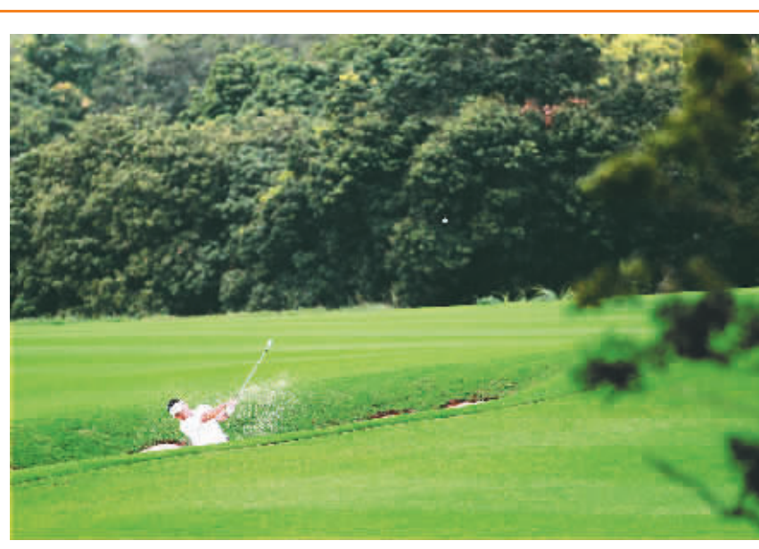
11月26日,新加坡选手马丹·马玛在第三轮四人四球第十洞比赛中。