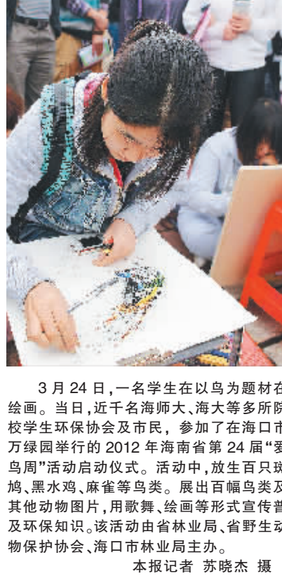
3月24日,一名学生在以鸟为题材的绘画。当日,近千名海师大、海大等多所高校学生环保协会及市民,参加了在海口市万绿园举行的2012年海南省第24届“爱鸟周”活动启动仪式。