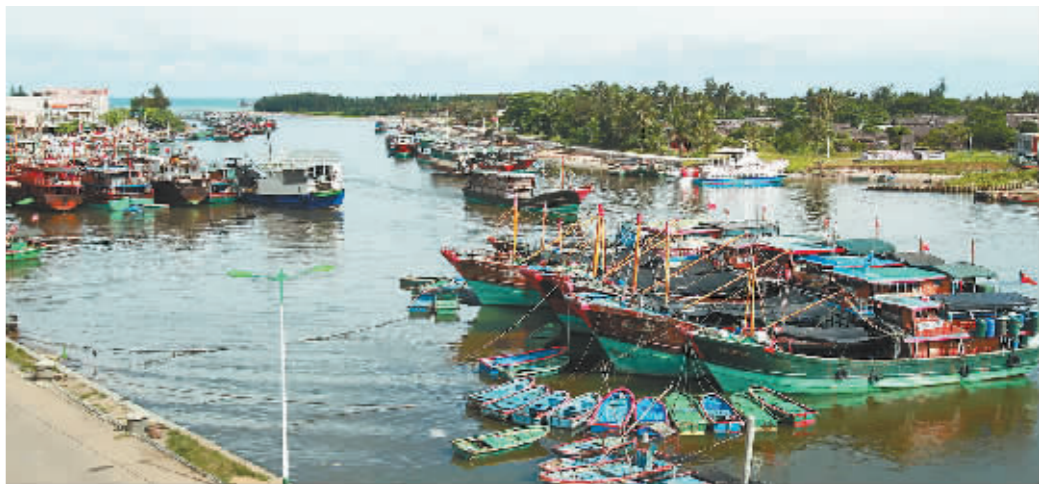
琼海潭门渔港。在早年的记载中称大潭港，开往南海作业的渔船大都从这里起锚。