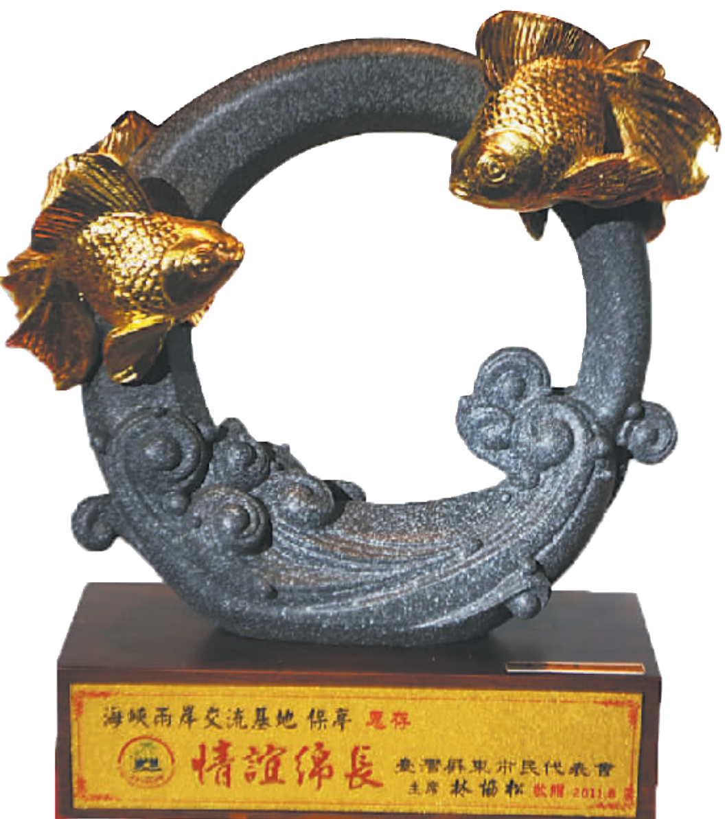
台湾屏东市民代表会赠送的礼品。