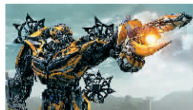
大黄蜂手握光速炮。

身上作战,预计在香港大战中,机器恐龙将助力博派战士,成为取胜的关键。三张剧照中有两张都出现了大反派“禁闭”的“云伪装”战舰,可见《变形金刚4》中“禁闭”或会取代惊天成为一号反派。