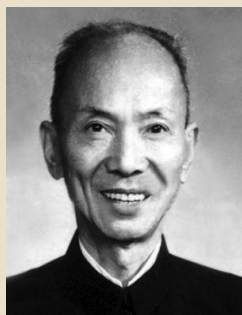
中国侦探小说家第一人程小青